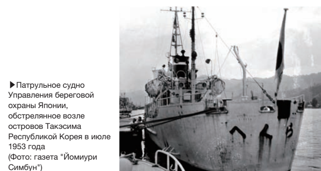
▶ Патрульное судно Управления береговой охраны Японии, обстрелянное возле островов Такэсима Республикой Корея в июле 1953 года