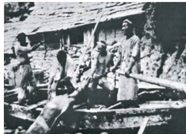
▲ Рыболовецкая компания Такэсима около 1909 года. ▶ Японские рыбаки вели активный промысел на островах Такэсима и вокруг них. (1930-е гг.)