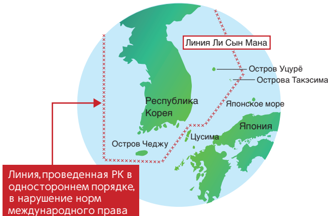
▲ Свидетельство безосновательности претензий Республики Корея: письмо Дина Раска, тогдашнего помощника Государственного секретаря США по вопросам Дальнего Востока, датированное августом 1951 г. (копия)

in the Declaration. As regards the island of Hokdo, otherwise known as Takekima or Liancourt Rocks , this normally uninhabited rock formation was according to our information never treated as part of Korea and, since about 1905, has been under the jurisdiction of the Oki Islands Branch Office of Simane Prefecture of Japan. The island does not appear ever before to have been claimed by Korea. It is understood that